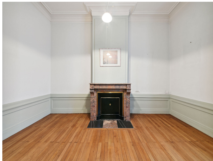
Réf : 8JOFFRE

Immobilière DABRETEAU vous propose à la location, des bureaux de 128 m 2 , situés en plein quartier AINAY au 8 Quai Maréchal Joffre 69002 LYON. Venez découvrir ces magnifiques bureaux en rez-de-chaussée surélevés d'un bel immeuble ancien, juste en face des quais de Saône. Une tranquillité de travail et un confort géographique, puisque tout proche des axes autoroutiers sud et nord. Les bureaux se composent d'une entrée chaleureuse et accueillante pouvant faire office de salle d'attente. Quatre grand bureaux avec une cheminée dans chaque bureau et fenêtre attenante, offre espace et luminosité. Un dernier bureau plus petit peut faire office d'une salle d'archive ou de salle de bains pour les collaborateurs. Une cuisine indépendante donne sur la cour intérieur au calme. WC privatif. Le chauffage est individuel électrique (avec une chaudière). L'eau chaude et l'eau froide sont individuelles également. Bail professionnel uniquement.