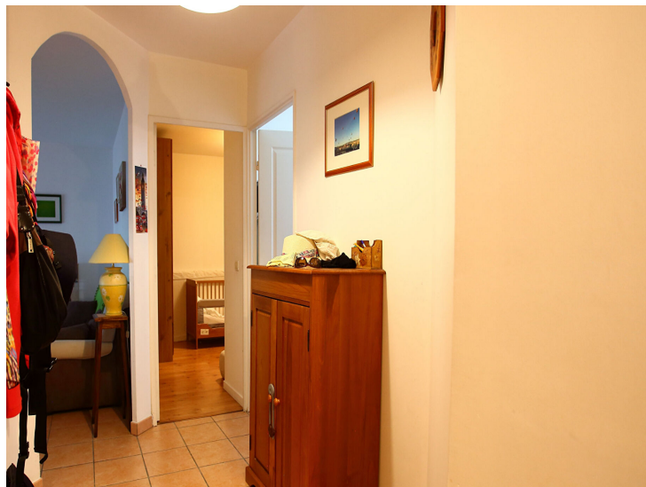
Réf : 12 ULTRILLO

Immobilière DABRETEAU vous propose à la location, un appartement de type 4 de 82.35 m², situé au 1er étage d'une résidence sécurisée des années 2000, au 12 et 14 Rue Maurice Ultrillo 69500 BRON. L'appartement se compose d'une entrée avec des rangements donnant sur un grand séjour familiale, baigné de lumière avec une loggia d'environ 8 m². Une cuisine fermée très fonctionnelle donne également sur une seconde loggia de 4 m² environ. Trois belles chambres au calme dont deux qui ont un placard coulissant. Une salle de bains et WC séparé. Le chauffage est individuel au gaz. L'eau chaude et l'eau froide sont individuelles.