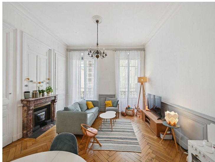
Réf : 246LAFAYETTE

Immobilier DABRETEAU vous propose à la location, un appartement de type 3 meublé, d'une surface de 77.12 m 2 situé au 2ème étage avec ascenseur d'un immeuble haussmien. L'appartement se compose d'un hall d'entrée avec un placard de rangement qui conduit à une belle cuisine toute équipée et très fonctionnelle ouverte sur le salon, baigné de lumière avec une très belle hauteur sous plafond. Un coin buanderie fermé avec une machine à laver et chaudière à gaz. Une chambre parentale avec placard de rangement et une deuxième chambre pour enfant avec une mezzanine. Une très belle salle de douche avec double vasque. WC séparé. Le chauffage est individuel (radiateur gaz), l'eau chaude et l'eau froide sont individuelles également. Un local à vélo est en RDC d'immeuble. Le loyer de référence est 1 041.12€ HC/mois, soit 13.50€/m 2 . Le loyer plafonné est de 1 249€ HC/mois, soit 16.20€/m 2 . Un complément de loyer de 61€/mois est ajouté compte tenu de la qualité du mobilier laissé sur place, qu'une machine à laver et un lave-vaisselle sont présents. Les informations sur les risques auxquels ce bien est exposé sont disponibles sur le site Géorisques : www.georisques.gouv.fr