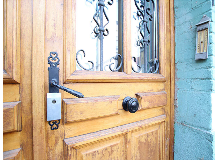
Programme Immobilier d'Exception à Villeurbanne

A VILLEURBANNE, (69100), 36 rue Jules Vallès, un ensemble immobilier comprenant :