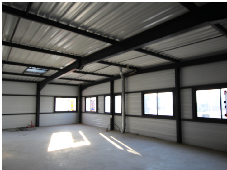
Réf 120AMPERE :

Belle superficie de 150 m 2 de bureaux entièrement neufs à aménager ! Ils sont situés au 1er étage du 120 Rue Ampère à Chaponnay dans une zone d'activité, l'accès se fait par des escaliers privés.