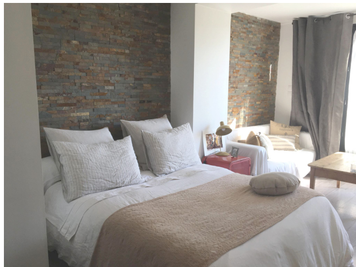
Réf 34 VIANNEY :

Immobilière DABRETEAU vous propose un joli studio entièrement meublé de 26 m² avec jolie petite terrasse situé en rez-de-chaussée du 34 Rue Jean Marie Vianney 69130 ECULLY dans une belle copropriété. Proche du centre d'Ecullly village. Le chauffage est collectif au gaz avec radiateur. L'eau chaude et l'eau froide sont collectives également.