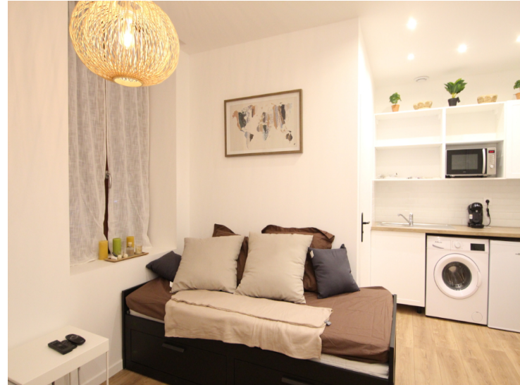
Réf : 5 TERRAILLES

Immobilier DABRETEAU vous propose un studio de 16.76 m 2 entièrement rénové et meublé avec goût, situé au 5 Rue Terraille 69001 LYON donnant sur l'intérieur de la copropriété. Proche de la place Hôtel de Ville, vous pourrez profiter du dynamisme de ce quartier. Idéal pour un(e) étudiant(e) ou jeune actif ! Le chauffage est neuf individuel électrique et l'eau chaude et l'eau froide sont individuelles avec cumulus.