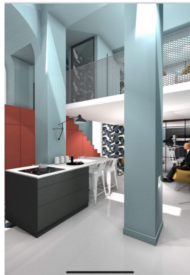
Réf : 16ZOLA (image 3D)

Immobilière DABRETEAU vous propose à la location, un magnifique appartement de 46 m 2 avec mezzanine, entièrement pensé et aménagé par un architecte, situé en rez-de-chaussée sur cour intérieure et sécurisée au calme. En plein quartier de la presque île, venez découvrir au 16 Rue Emile Zola 69002 LYON, ce bien d'exception. Il est composé d'un hall d'entrée donnant directement sur une belle pièce de vie chaleureuse avec une cuisine ouverte, équipée et aménagée avec goût. De belles hauteurs sous plafond avec de nombreux placards de rangement sont prévus pour plus de confort. A l'étage, le coin nuit avec un grand dressing et une salle de douche avec rangement. WC individuel avec un coin machine à laver et sèche-linge. Le chauffage est individuel électrique. L'eau chaude et l'eau froide sont individuelles également. Le loyer de référence est de 685,40€HC/mois, soit 14,90€/m 2 . Le loyer plafonné est de 823,4€ HC/mois, soit 17,90€/m 2 . Un complément de loyer de 473€ est ajouté compte tenu du fait que l'appartement a été intégralement refait à neuf et que le mobilier est de qualité et